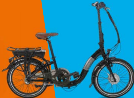
Fongers E-Folding N3 324 Wh