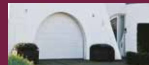
W-SERIE : WOODGRAIN