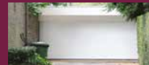
L-SERIE : STUCCO