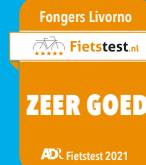
Fongers Livorno Dames 522 Wh