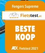
Fongers Supreme Disc 522 Wh