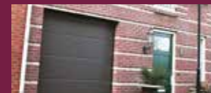
D-SERIE : DESIGN-LINE