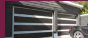
T-SERIE : TOP-LINE