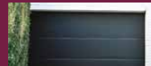
G-SERIE : GLAD