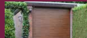
F-SERIE : HOUTLOOK